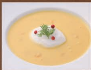
コーンクリームスープ ¥482 税込 ¥530