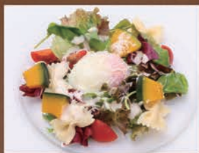
パンブキンと温泉卵のシーザーサラダ ¥600 税込 ¥660