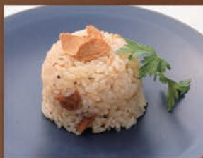
オランダ屋特製ガーリックピラフ ¥691 税込 ¥760