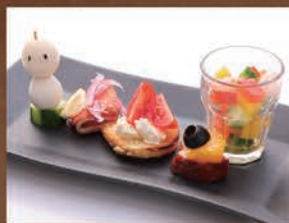
季節の前菜盛り合わせ ¥691 税込 ¥760