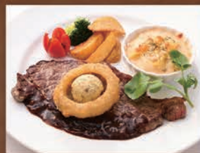
特選牛ステーキ ミニホワイトグラタン付き シャリアビンソース仕立て ¥1,619 税込 ¥1,780