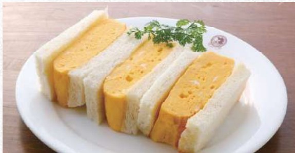
厚焼きたまごサンド 自家製パンにふわふわの厚焼き玉子 780yen