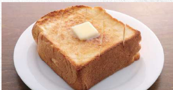
トースト 厚切りの自家製絶品トースト 380yen