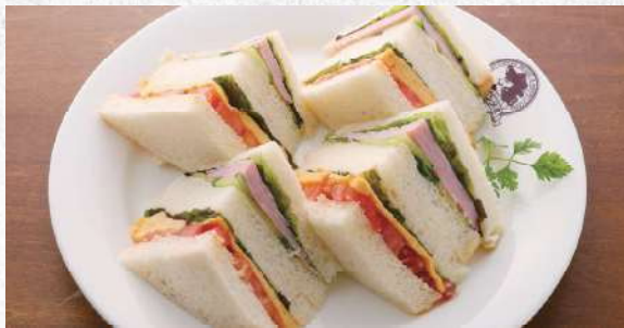
ミックスサンド 自家製パンを使ったボリューム満点サンド 780yen