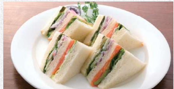
スモークサーモンサンド サーモンとベジタブルのヘルシーサンド 840yen