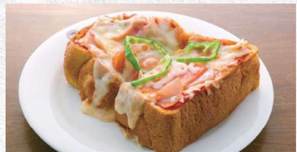
ピザトースト 厚切りの自家製パンをピザ風にアレンジ 640yen