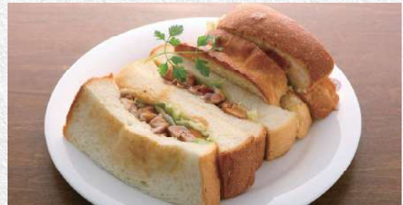
照り焼きチキンサンド 自家製パン使用の照り焼きチキンサンド 840yen