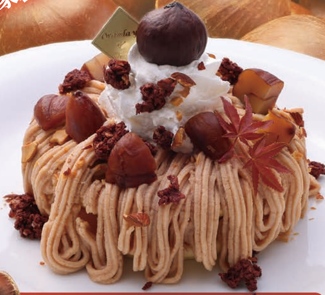
こぼれる渋皮栗のモンブランパンケーキ

渋皮栗がたっぷり！ ふわふわホイップ&カスタードのWクリーム、 自家製マロンクリームがたまらない マロンを存分に味わえるパンケーキ ¥1,280