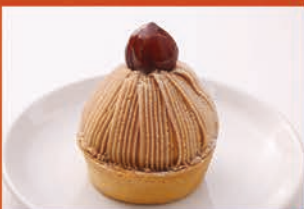
渋皮栗のモンブラン ¥580