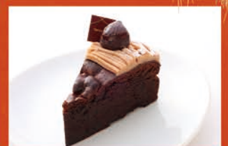
栗のガトーショコラ ¥480