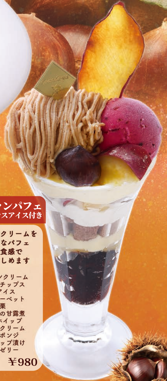
秋の味覚モンブランパフェ カシスアイス付き

渋皮栗がたっぷり！ ふわふわホイップ&カスタードのWクリーム、 自家製マロンクリームがたまらない マロンを存分に味わえるパンケーキ ¥1,280