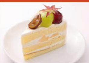
マロンと季節の フルーツショート ¥560