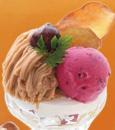
自家製マロンクリームの ミニモンブランパフェ