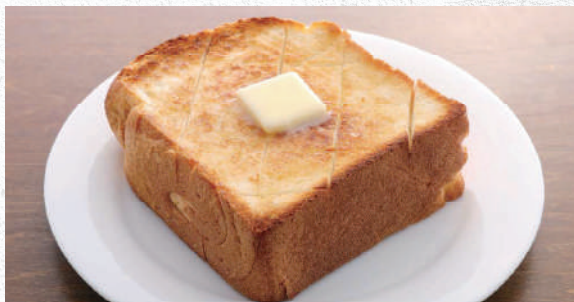
トースト 厚切りの自家製絶品トースト 380yen