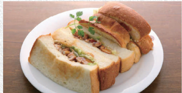
照り焼きチキンサンド 自家製パン使用の照り焼きチキンサンド 840yen