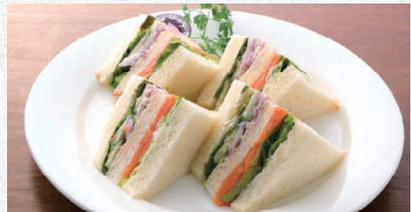
スモークサーモンサンド サーモンとベジタブルのヘルシーサンド 840yen