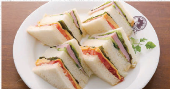
ミックスサンド 自家製パンを使ったボリューム満点サンド 780yen