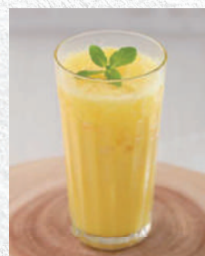
ミックスジュース 680yen

創業50年の伝統レシピで愛されるオリジナルミックスジュースは濃厚な甘みがくせになる昔ながらの喫茶店の味です。