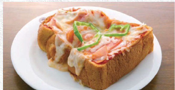
ピザトースト 厚切りの自家製パンをピザ風にアレンジ 640yen