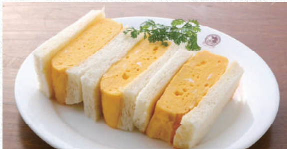
厚焼きたまごサンド 自家製パンにふわふわの厚焼き玉子 780yen