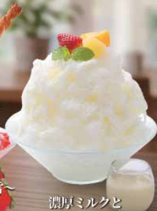
濃厚ミルクと フルーツのかき氷