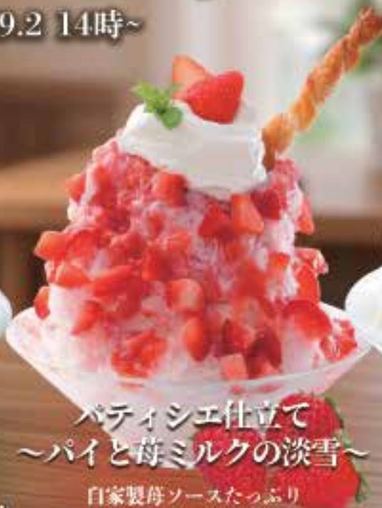
パティシエ仕立て ~パイと苺ミルクの淡雪~

自家製苺ソースたっぷり サクサク香ばしいパイと重なり まるで苺のミルクフィーユなかき氷