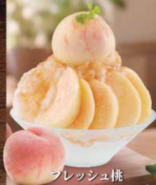
フレッシュ桃 まるまるひとつのかき氷