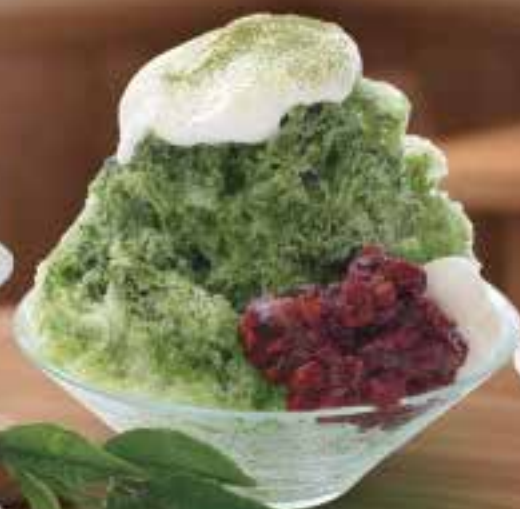
自家製ソースの 京都産宇治抹茶のミルク金時