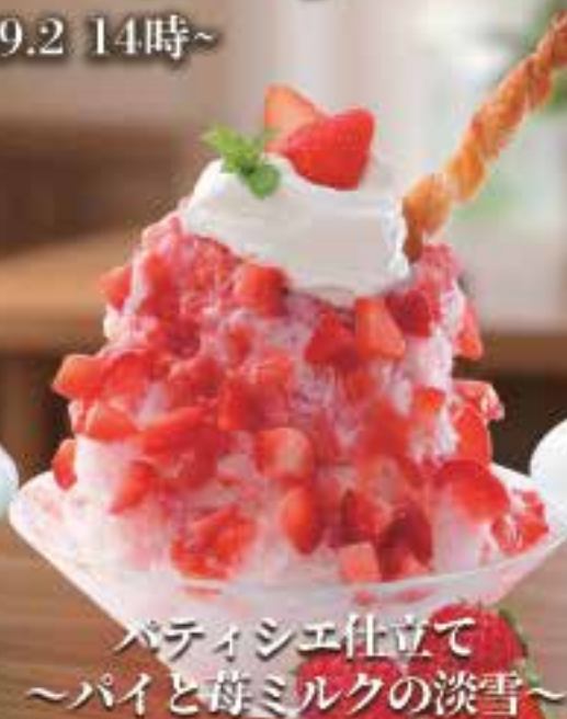
パティシエ仕立て ~パイと苺ミルクの淡雪~

自家製苺ソースたっぷり サクサク香ばしいパイと重なり まるで苺のミルクフィーユなかき氷