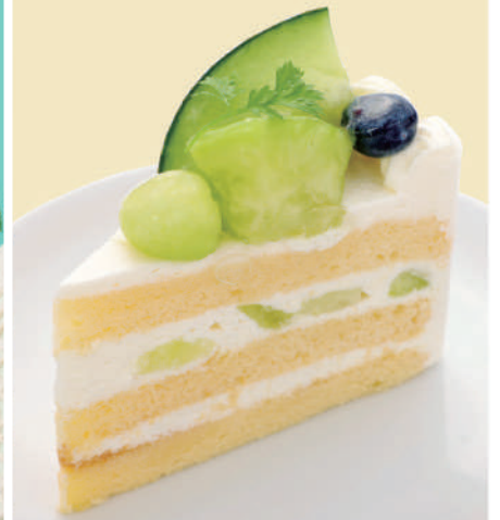
メロン ショートケーキ