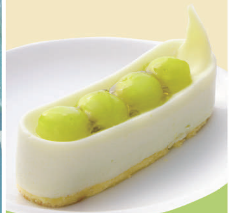
初夏の メロンムース