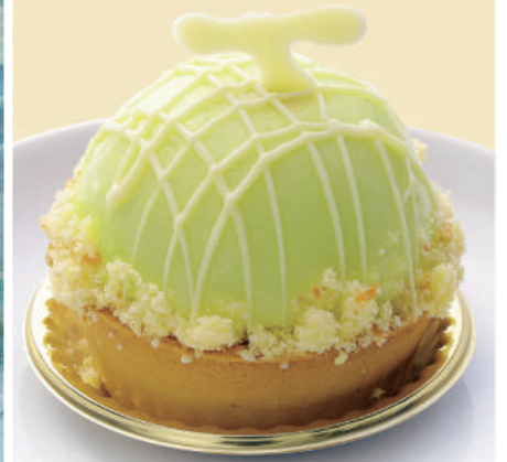
贅沢メロンの まんまるタルト