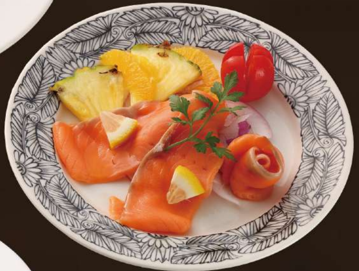
スモークサーモン

特選ローストビーフと玉ねぎと赤ワインの風味豊かなソース 891yen 980yen税込