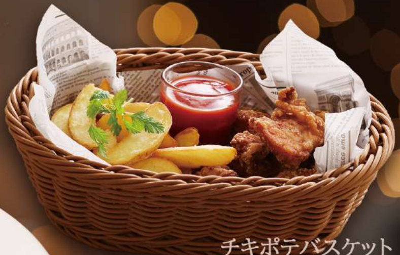
チキポテバスケット

揚げたて鶏唐揚げとフライドポテトの王道の組み合わせ 618yen 680yen税込