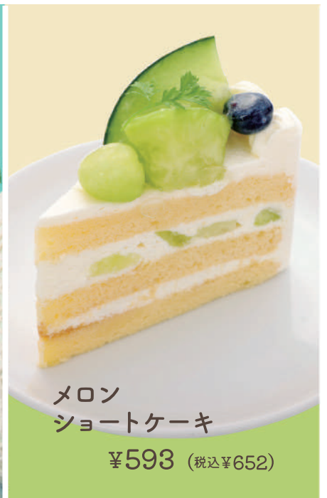
メロン ショートケーキ