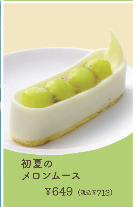
初夏の メロンムース