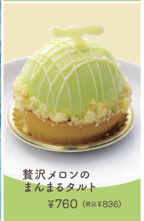
贅沢メロンの まんまるタルト