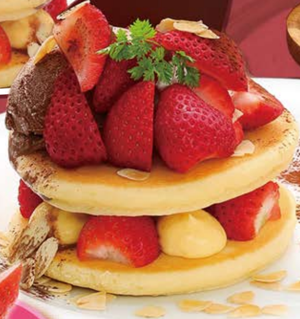
提供14:00~ 苺のパンケーキ ショコラソース ¥1,164 (¥1,280税込)