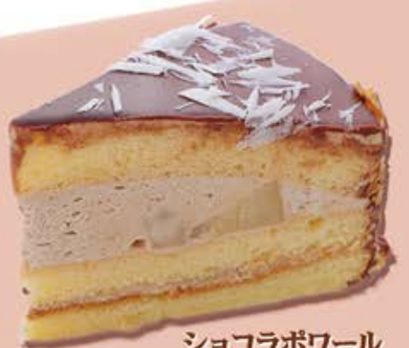
ショコラパワー ¥464 (¥510税込)