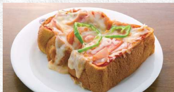
ピザトースト 厚切りの自家製パンをピザ風にアレンジ 640yen