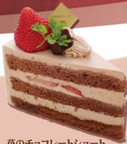
苺のチョコレートショート ¥509 (¥560税込)