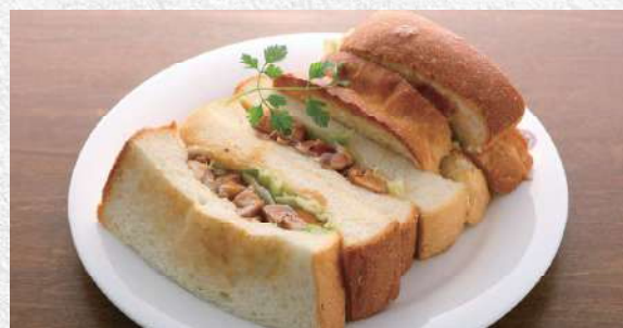
照り焼きチキンサンド 自家製パン使用の照り焼きチキンサンド 840yen