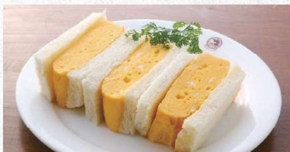
厚焼きたまごサンド 自家製パンにふわふわの厚焼き玉子 780yen