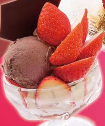
提供14:00~ 苺とチョコレートのミニパフェ ¥618 (¥680税込)