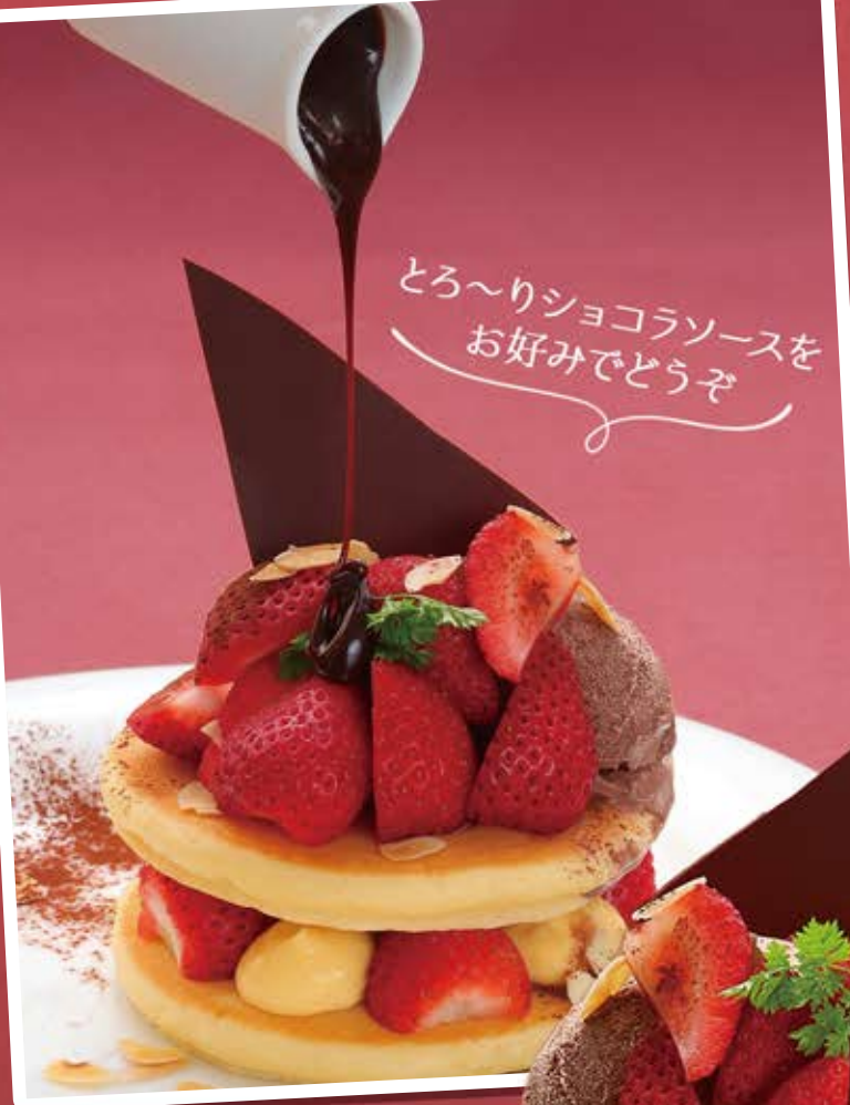
提供14:00~ 苺のパンケーキ ショコラソース ¥1,164 (¥1,280税込)