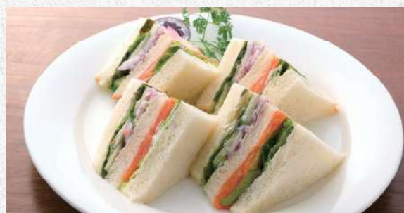
スモークサーモンサンド サーモンとベジタブルのヘルシーサンド 840yen