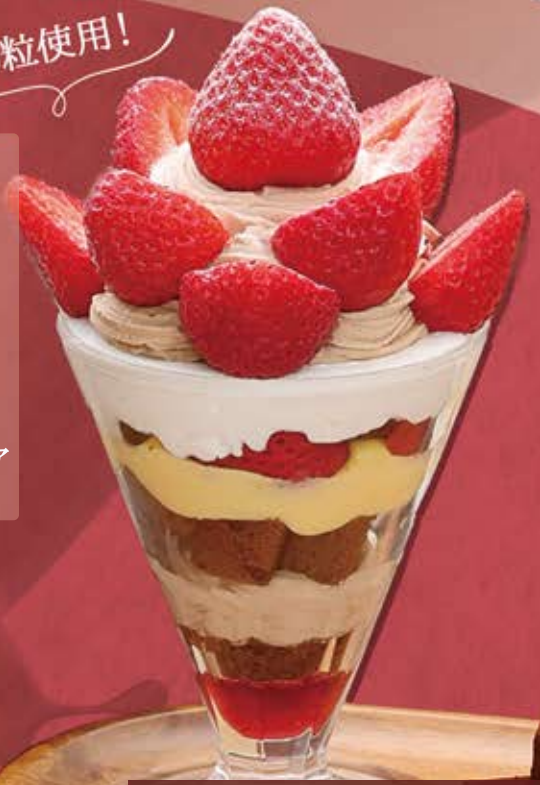
提供14:00~ 苺とチョコレートのパフェ ¥1,164 (¥1,280税込)