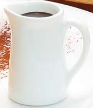
提供14:00~ 苺のパンケーキ ショコラソース ¥1,164 (¥1,280税込)