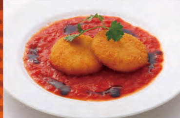
季節の前菜~ズワイガニのカクテルソース~ ¥982 (¥1,080税込)