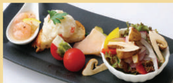
前菜盛り合せ〜松茸の薫り〜 ¥1,180 税込