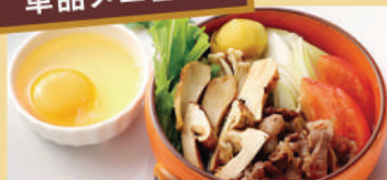
松茸のすき焼き 栗入り ¥1,880 税込