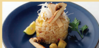
松茸ピラフ 栗入り ¥1,180 税込