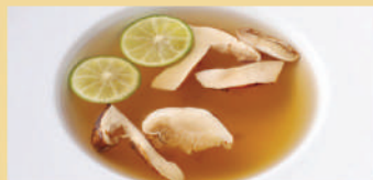
松茸の洋風スープ 酢橘添え ¥880 税込