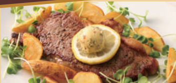
特選牛ステーキ 3種の味の食べ比べ ¥1,780 税込