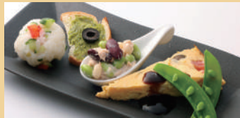
夏畑の前菜盛り合わせ ¥630 税込