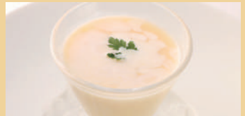
冷製 豆乳のコーンスープ ¥480 税込