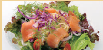
スモークサーモンの冷製パスタ サラダ仕立て ¥680 税込