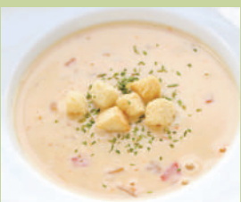
クリーミー クラムチャウダー ¥480 税込