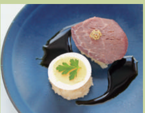
ローストビーフとたまごの 洋風手まり寿司 ¥480 税込

提供期間: 3/1(金)~5/8(水) 提供時間: 月・火・水・木・日 [17:30~20:30] 金・土・祝前日 [17:30~21:30]