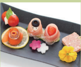
季節の前菜 ~雑祭り風~ ¥780 税込