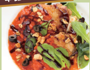
チキンのパリッとポワレ バルサミコ&トマトソース ¥1,380 税込