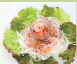
新玉ねぎの 鰹節香るサラダ ¥580 税込